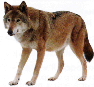
Un loup et son épaisse fourrure

Le loup a un odorat très puissant qui lui permet de repérer ses proies.