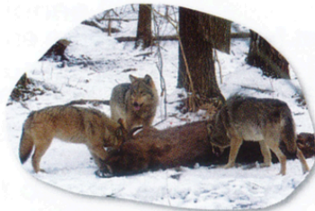
Le repas des loups

Souvent, ils chassent en meute pour attraper de gros animaux.