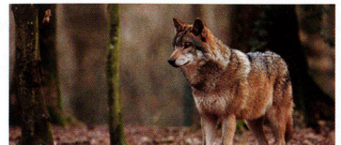
Un loup dans son habitat naturel

Le loup vit un peu partout sur la terre, loin des habitations.