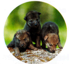
Une portée de louveteaux